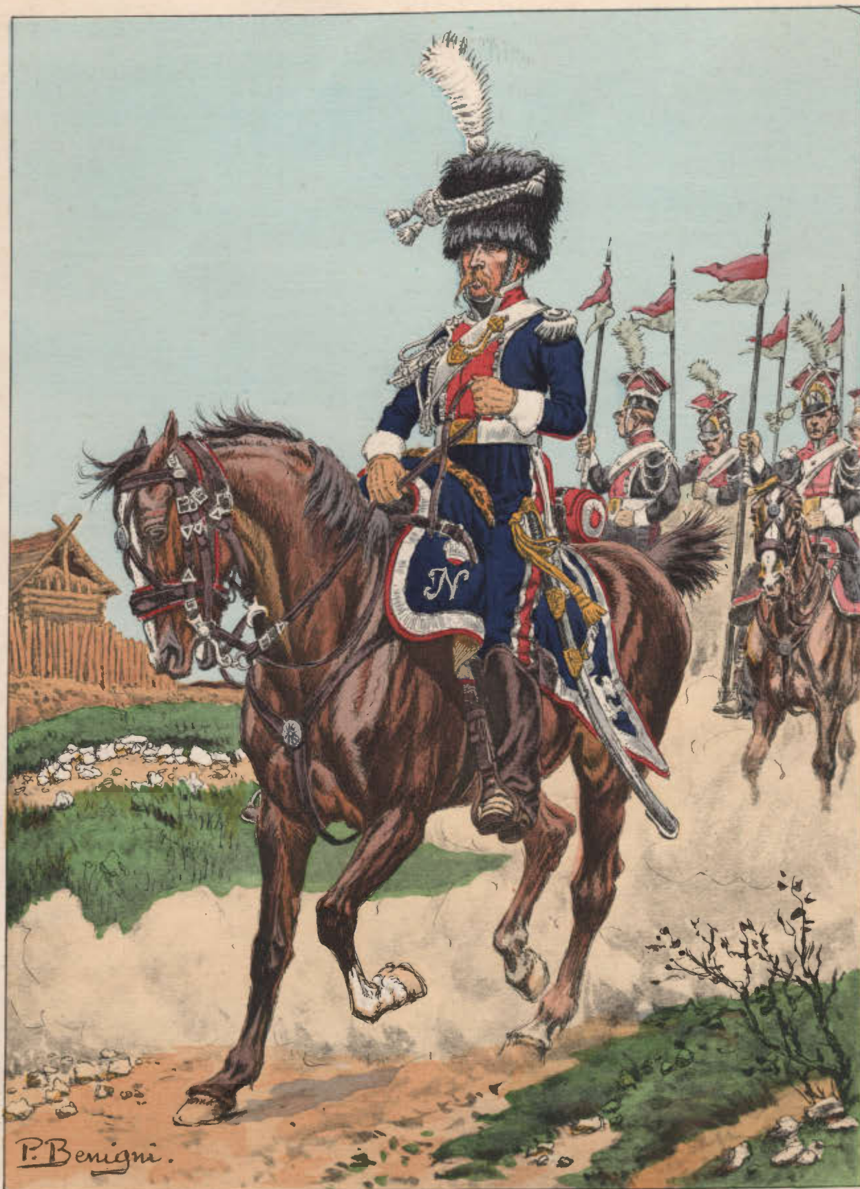
1 er RÉGIMENT DE CHEVAU-LÉGERS LANCIERS DE LA GARDE IMPÉRIALE (LANCIERS POLONAIS)

Officier à la bataille de la Moskowa — 1812.